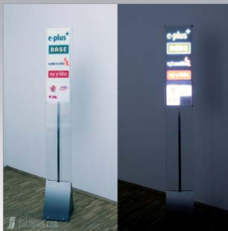
Wirkung // on // off

www.flatlights.com/produkte/leuchtdisplays/el-standdisplays